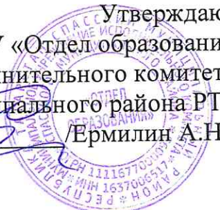
График проведения и состав участников